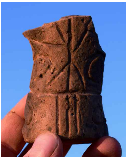
Torzo neolitické plastiky z pálené hlíny. Lipník nad Bečvou (okr. Přerov).

Výška dochované části keramické plastiky činí 76 mm. Hlava byla v minulosti odlomena. V horní části torza trupu je na jedné straně patrný náznak vyběhající paže. Spodní část torza plastiky tvoří kuželovitě se rozšiřující podstava, přičemž nohy nejsou plasticky znázorněny. Povrch je z jedné strany pokryt nápadnými rytými ornamenty, které mohou naznačovat výzdobu oděvu, popřípadě by mohlo jít o schematické znázornění částí lidského těla.